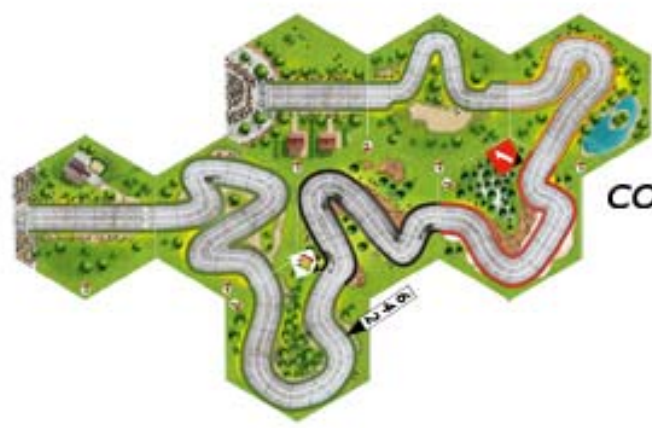
COURSE N°4 Dimanche 5 Juillet 13h30