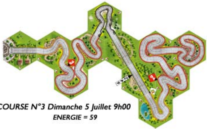
COURSE N°3 Dimanche 5 Juillet 9h00