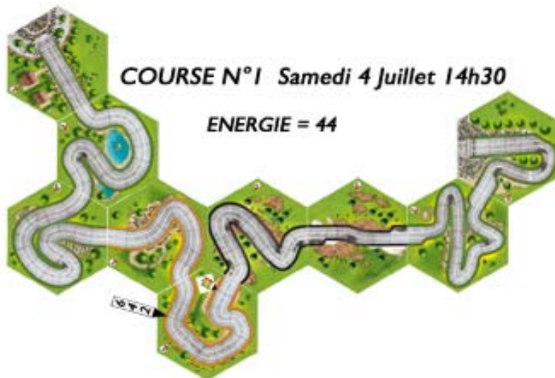
COURSE N°1 Samedi 4 Juillet 14h30